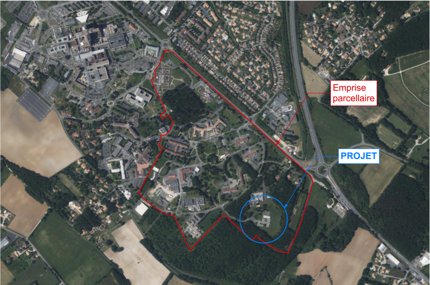
Vue aérienne - Extrait géoportail IGN - Sans échelle.